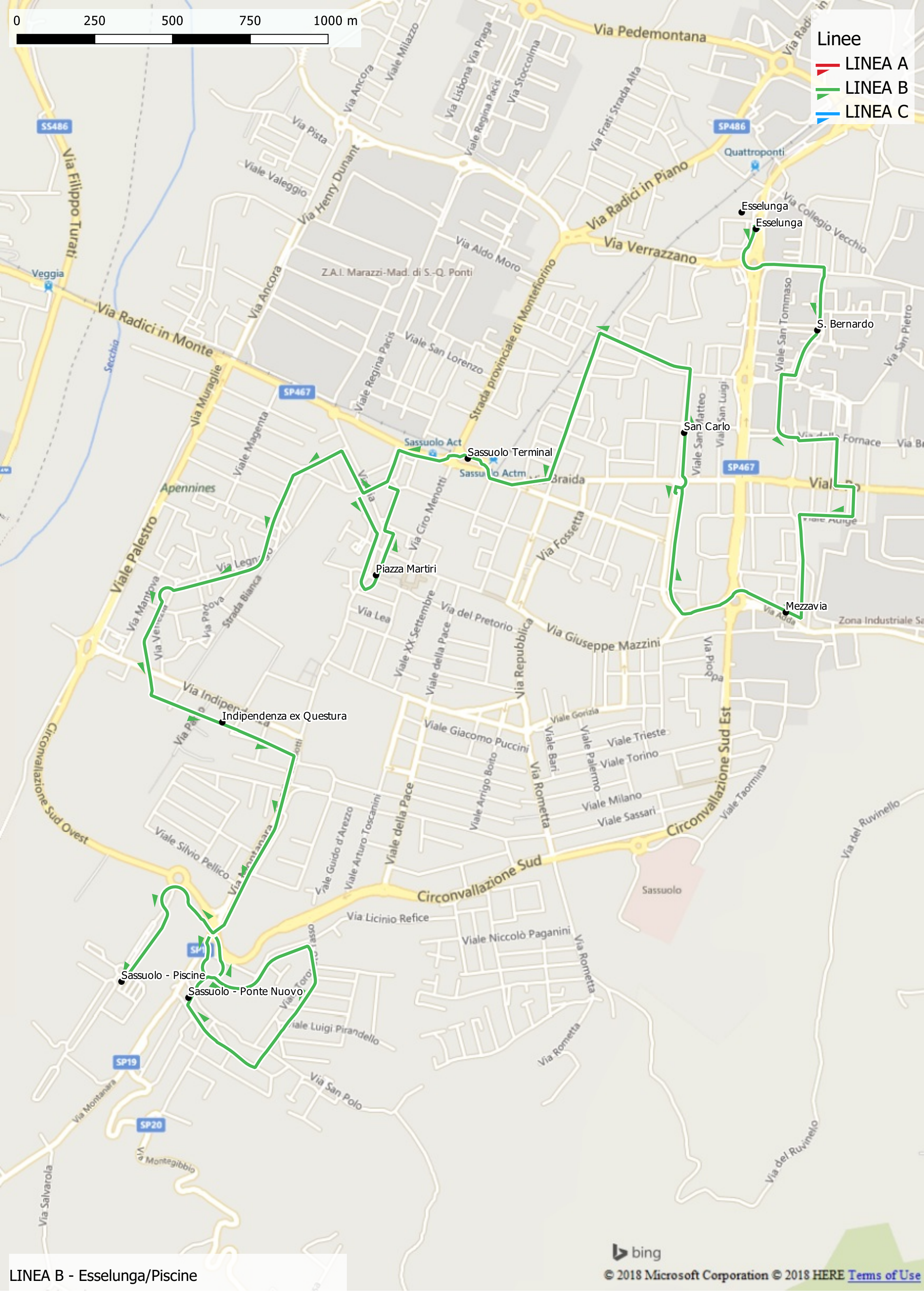
LINEA B - Esselunga/Piscine