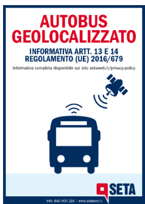
Figura 1: informativa sintetica AUTOBUS GEOLOCALIZZATO presente in prossimità della porta di salita dei mezzi di SETA S.p.A.