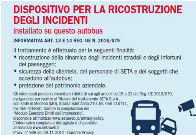
Fig.2 informativa sintetica DISPOSITIVO PER LA RICOSTRUZIONE DEGLI INCIDENTI